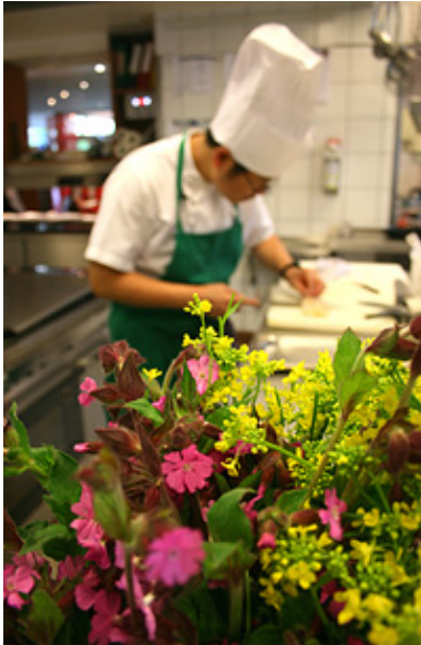
Einer der Köche im Vieux Sinzig bei der Arbeit