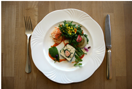
Das Resultat von Dumains Arbeit

Als Vorspeise: Lachstatar mit knusprigen Schlüsselblumenblättern oder Vogelmierensuppe mit Maisravioli. Als Hauptgang: Huflattich-Kartoffel-Gratin oder Eifelkalbsrücken mit Waldkritz-Sauce, Pestwurz und Mangold. Und als Dessert: Japanischer Knöterich im Knuspermantel mit Veilchensorbet auf Zitrusfrüchtesalat oder Löwenzahn-Tiramisu. Was sich exotisch anhört, ist bodenständiger, als man glauben möchte. Dumaine mutmaßt: „Es gibt so viele versteckte Plätze in dieser Region. Manchmal glaube ich, wir sind blind in unserer eigenen Heimat, da wir nur noch in die Ferne gucken.“ Mit seiner regionalen Wunderküche will er Verbindungen schaffen, zu dem Ort, an dem man lebt.